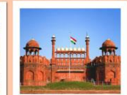
♥♦♦ Agra Fort