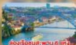
ล่องเรือชมสะพาน 6 แห่ง ในคูเมืองปอร์โต