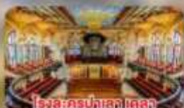
โรงละครปลาส เดลา มูสิกา คาตาลา