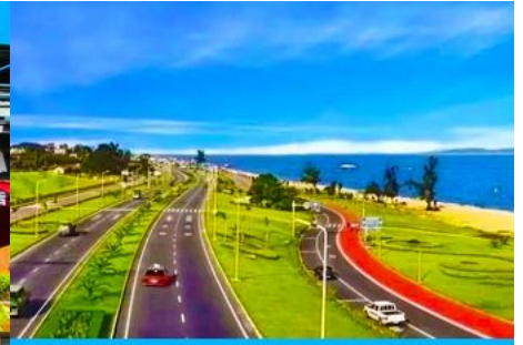
ถนนหวนเต่าลู่