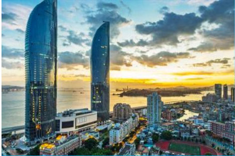
นครซีเยเหมิน

23.30 น. คณะเดินทางพร้อมกันที่ ท่าอากาศยานสุวรรณภูมิ อาคารผู้โดยสารขาออกชั้น 4 ประตูหมายเลข 10 เคาน์เตอร์ เช็คอิน สายการบิน XIAMEN AIRLINES (MF) เจ้าหน้าที่บริษัทฯ คอยให้การต้อนรับและอำนวยความสะดวกในการเช็คอิน