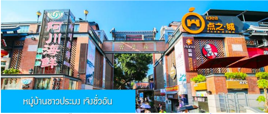
หมู่บ้านชาวประมง เจิงจ้าวอัน