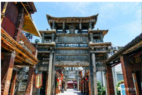
ถนนโบราณหมิงชิงแห่งเมืองจางโจว