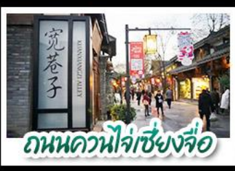
ถนนควงหนิงเจียงจื่อ