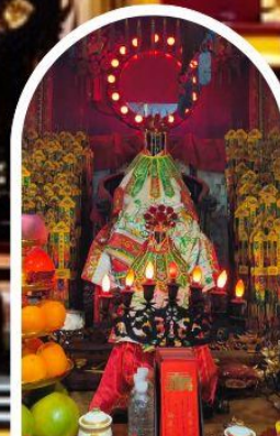
วัดเจ้าแม่กวนอิมอ่องฮำ

เสริมโชคลากนำความรุ่งเรืองทุกด้านของชีวิต