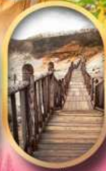
หุบเขาจิกุคาบิ