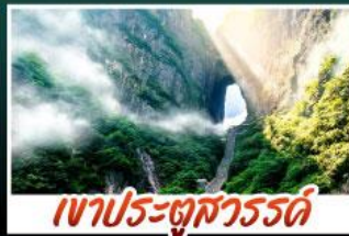
เขาประตูลสวรรค์