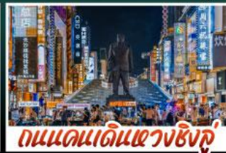
ถนนแดนเดินแดงซิงกู่