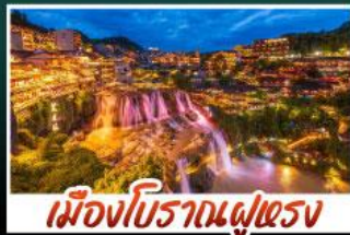
เมืองโบราณผู่ตง