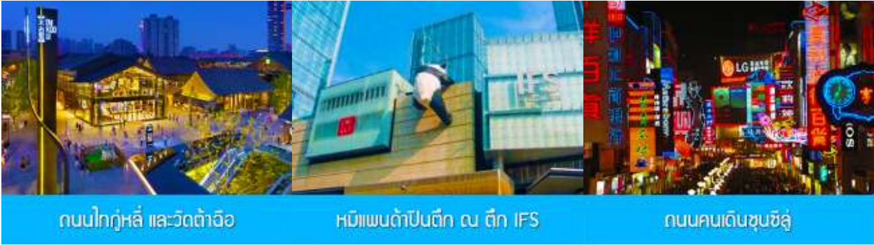
ถนนไท่กุ่หลี่ และวัดต้าอ้อ