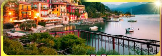
ทะเลสาบโตโบ