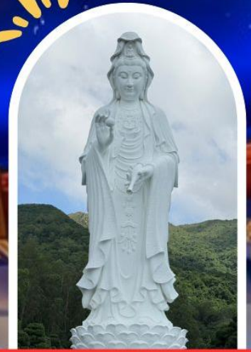
วัดซีซัน