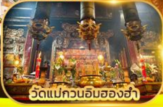
วัดแม่กวนอิมของฮ่า