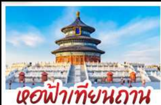
เขื่อนฟ้าเทียนถ่าน