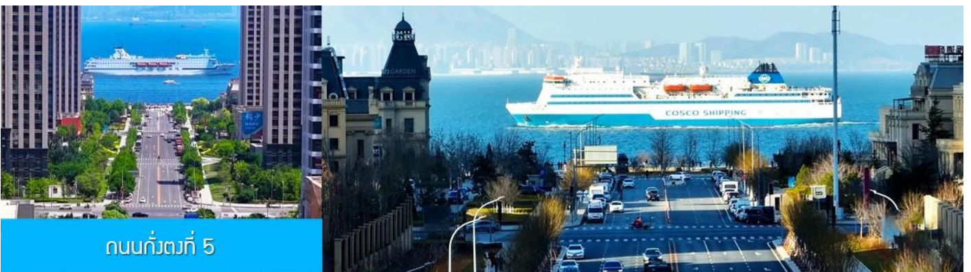
ถนนกว้างที่ 5

จากนั้นนำท่านเที่ยวชม สวนน้ำเมืองเวนิสตะวันออก 大连东方威尼斯城 เป็นเมืองเวนิสจำลองที่ถูกสร้างขึ้นด้วยทุนกว่า 8,000 ล้านดอลลาร์ ออกแบบโดยบริษัท ARC จากประเทศฝรั่งเศส โดยจำลองผังเมืองเวนิสในประเทศอิตาลี บนพื้นที่กว่า 400,000 ตารางเมตร ประกอบด้วยคลองเวนิสและอาคารที่มีสถาปัตยกรรมแบบตะวันตกกว่า 200 หลัง มีบริการล่องเรือคอนโดล่าแก่นักท่องเที่ยว นำท่านเดินชม ถ่ายภาพที่ระลึกท่ามกลาง