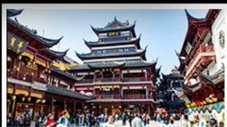
ตลาดร้อยปีเจิ้งหวงเหมียว