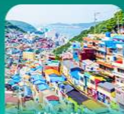
หมู่บ้านดัมซอน