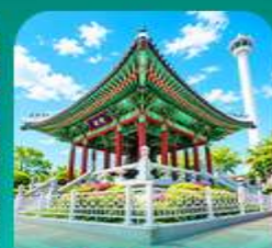
สวนเขงดูซาน