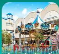
ลือตเต็ เอ้าท์เก็ต