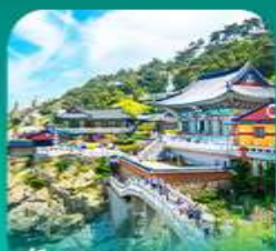
วัดแฮดงกุงซา

เที่ยวปูซานแบบแกรนด์ แกรนด์ ทั้งสายอาร์ท สายบู และสายช้อปปิ้ง • เขิกจันบนท่าฮุนสึคิลเลอร์ฟลา ที่ท่าเรือจินบี (BUSAN BUNEZIA) เติบสมหมู่บ้านคิมซอน ซาซโดริแห่งปูซานสุดน่ารัก พลาดไม่ได้กับการนั่งรถไฟปูกัน ขบวนทะเลเมืองปูซาน • เสริมสิริมงคลที่วัดแฮดงกุงซา วัดริมทะเลชื่อดัง พร้อมช้อปปิ้งที่ลือชื่อเตรียมเจ้ากั๊ก และตลาดบันโพดง ก่อนปิดท้ายด้วย ย่านวีฮุนสุดชิค ซอ มยอง อตนิว พร้อมชมวิวสะพาน ควังอินยามคำคืนสุดโรแมนติก