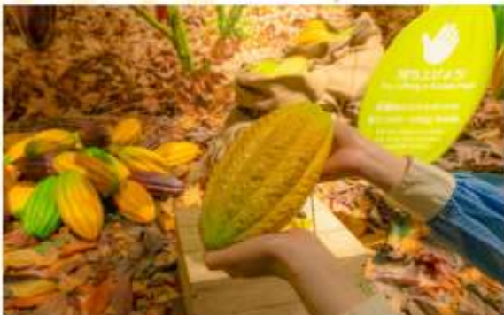
ROYCE CACAO & CHOCOLATE TOWN