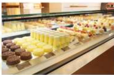
FURANO DELICE CAFE