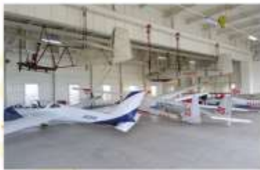
TAKIKAWA SKY PARK MUSEUM