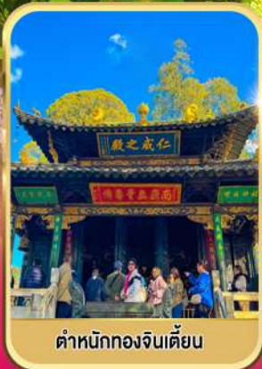
ตำหนักทองจินเตียน