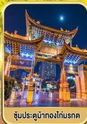
ซุ้มประตูม้าทองไถ่มรดก