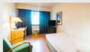
Single สำหรับ 1 ท่าน